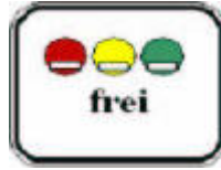
270.1e Ek İşaret