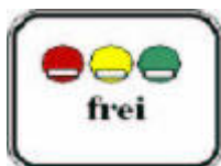
Дополнительный знак 270.1