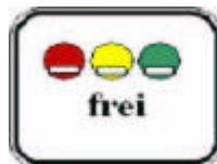
πρόσθετο σήμα στο 270.1