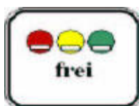
270.1 sz. kiegészítő közlekedési tábla