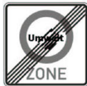
270.2 sz. közlekedési tábla

Környezetvédelmi matrica nélkül nem lehet behajtani a környezetvédelmi zónákba, még akkor sem, ha a gépkocsi kipufogó gázértékei alapján ezt megtehetné. Ezen előírás megsértése esetén a pénzbírság 40 euró, emellett a gépkocsi vezetőjének egy büntető pontot ( Flensburg) is kiszabnak. Ez a külföldön forgalomba helyezett gépkocsikra (személygépkocsira, tehergépkocsira, autóbusszra) is vonatkozik függetlenül attól, hogy mi a célja a zónába történő behajtásnak, üzleti út vagy turizmus.