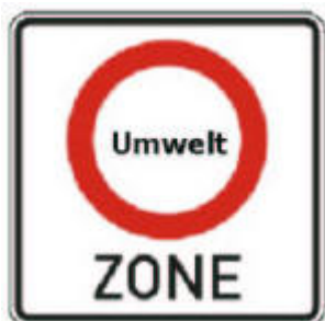
270.1. sz. közlekedési tábla

Majd ezt követte 2008. 01.12-től Dortmund után az ún. „Brackeler Straße” elnevezésű kis környezetvédelmi zóna, valamint 2008.március 1-én a kilenc Baden-württembergi város: Ilsfeld, Leonberg, Ludwigsburg, Mannheim, Mühlacker, Reutlingen, Schwäbisch-Gmünd, Stuttgart és Tübingen. A káros anyag kibocsátás által különösen veszélyeztetett területeket a 270.1 számú „ Umweltzone” (Környezetvédelmi zóna, l. alul lévő ábra) feliratú közlekedési táblával jelzik. Az ehhez szükséges kiegészítő jelzéseken pedig meghatározzák, hogy melyik gépkocsi milyen színű környezetvédelmi matricával hajthat be az adott zónába. A környezetvédelmi zóna végét a 270.2 számú közlekedési tábla ( l. alul lévő ábra) jelöli.