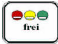
270.1e Ek İşaret