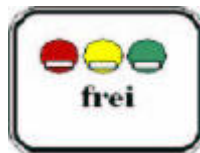
Señal adicional para 270.1