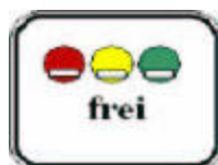
Znak dodatkowy do 270.1