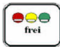
Simbolo aggiuntivo 270.1